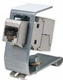
Adaptador RJ45 Keystone carril DIN abierto