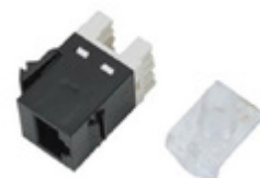
Modulares RJ45 y RJ49 Cat6 Hembra tipo 110 y AMP