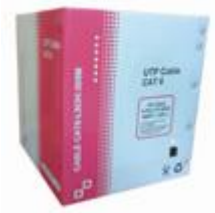
Cat5e y Cat6 UTP Flexible