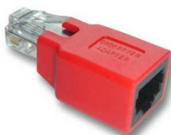
RJ45 M-H Aéreo Cruzado