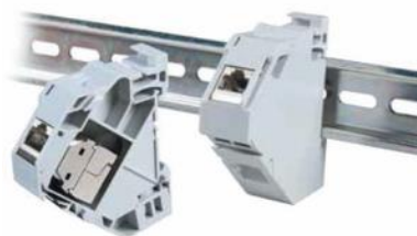
Adaptador RJ45 Keystone carril DIN cerrado