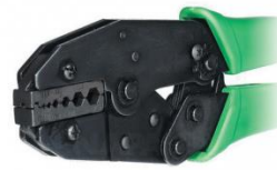
Crimpadora Coaxial Flex2-3-3,9-5