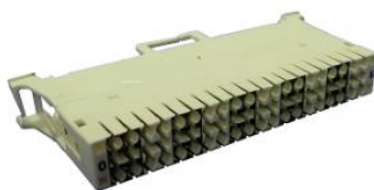
Regleta QDF, de Corte y Prueba