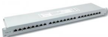
Panel 19" 1U FTP Cat5e 24pos