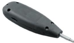
Impactadora QDF Cuello Corto o Largo