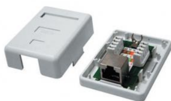
Roseta Ethernet Integrada o Vacía, Cat5e, Cat6 1 ó 2 RJ45, UTP, FTP