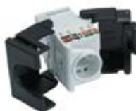
Modulares RJ45 Cat5e, Cat6 UTP Hembra Tipo 3M