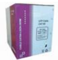
Cat5e y Cat6 UTP Rígido