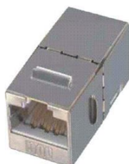
RJ45 HH Cat5e Cat6 FTP Keystone Apantallado Aéreo