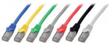
Cat6 UTP LSZH