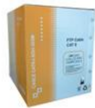
Cat5e y Cat6 FTP Rígido