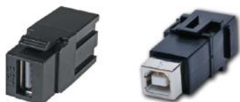
Adaptador Keystone USB - HDMI