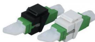
Adaptador Keystone Fibra Óptica E2000, SC, LC, ST