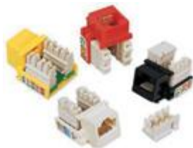
Modulares RJ45 y RJ49 Cat6 Hembra Codo tipo 110 y AMP