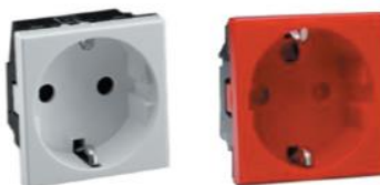
Base de Enchufe