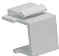
Tapa Ciega Keystone Panel