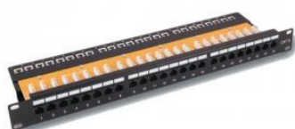
Panel 19" 1U UTP LSA 24p Bandeja