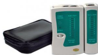
Tester RJ11 RJ45 USB