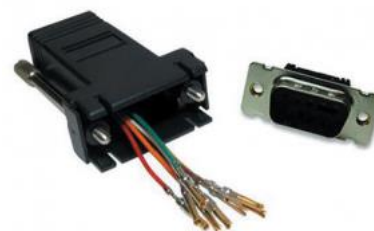
Adaptador RJ45 SubD 9-25v