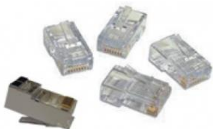
RJ45 y RJ49 Cat5e y Cat6, Macho, Flexible y Rígido