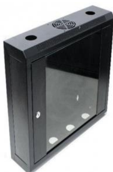
Rack Mural Serie RM19"