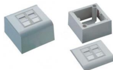
Roseta Ethernet de Superficie 80x80mm / 80x150mm