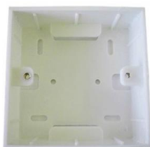
Caja de Superficie, Fondo 2,5- 3,8-4,5mm 80x80mm