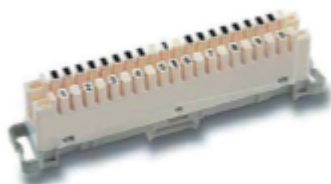
Regletas LSA 10 Pares, de Corte y Prueba