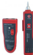
Sonda Localizadora de Fallos