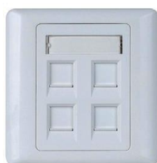
Tapa Frontal para Roseta Vacía, con Persiana 80x80mm