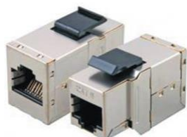
RJ45 HH Cat6 FTP Keystone Apantallado Panel