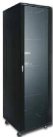
Rack Serie RS 19"