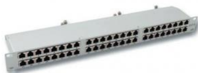
Panel 19" 1U FTP Cat6 48pos