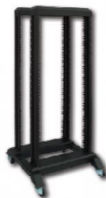
Bastidor Laboratorio 19"