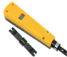
Impactadora Sistema 110 o Tipo Krone