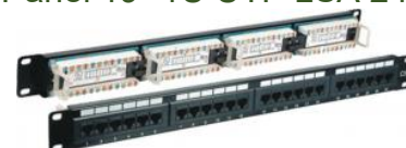
Panel 19" 1U UTP LSA 24p